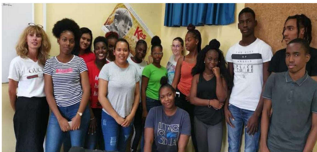
Les élèves d'une des classes de première L du lycée Gontran-Damas, à Rémire-Montjoly

Les 29 jeunes de la classe, même s'ils ne veulent pas devenir journaliste, ont tous participé. Ils ont évoqué leurs moyens de communiquer, qui passent beaucoup par le web, via les réseaux sociaux. Des sites qui, en quelques années, sont devenus incontournables et sur lesquels cette génération de millennials surfe quotidiennement. Ils ont préparé depuis le début de l'année scolaire tout un programme axé sur l'information, et ils se sont intéressés aux fake news . Ils ont ainsi réalisé leur propre conférence de rédaction, dirigée par une des élèves qui s'est